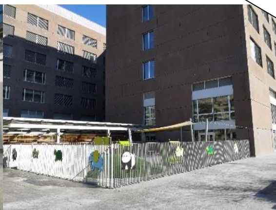
EVE LINA STERN